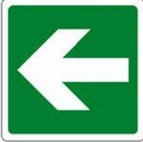
DIREZIONE VIA DI FUGA