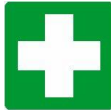
PRESIDIO PRONTO SOCCORSO