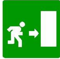
PERCORSO DA SEGUIRE USCITA DI SICUREZZA