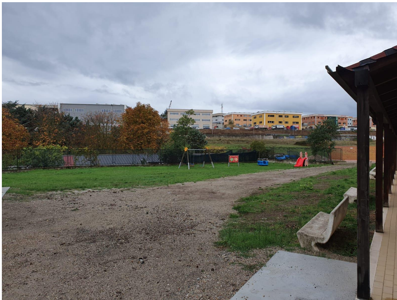
Punti di raccolta (cortile interno)

Tutto il personale, deve raggiungere l'Area di Raccolta assegnata e disposta nel cortile antistante il fabbricato, seguendo i percorsi di esodo stabiliti. Tale assegnazione in “luogo sicuro” è tale da permettere il coordinamento delle operazioni di evacuazione ed il controllo dell'effettiva presenza di tutti.